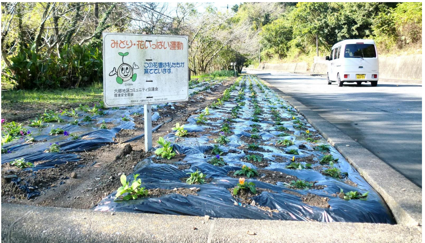
▲ 極楽寺通り(内海商店：東 400

草取り、土作り、植え替えの作業は、土日の午前中に 5~6 人のメンバーで行っております。もともと多くの方にお手伝いをしていただけると助かります。一緒に汗を流しませんか。これから冬に向けて満開になっていく様子を、ぜひお楽しみください。