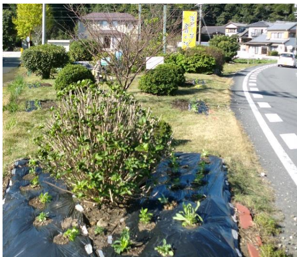
▼ 小出通り(アエル南 400