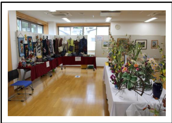
手芸、絵画、アートフラワー