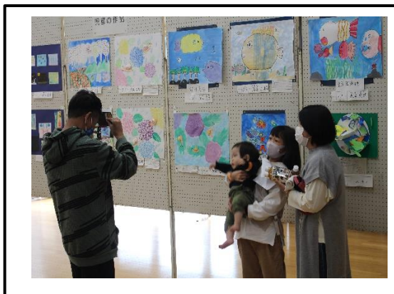
自分の作品の前でパチリ