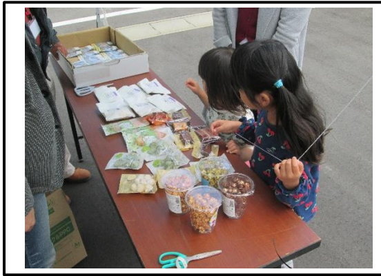
どれにしようかな？

屋内では、活け花、アートフラワー・編み物・絵手紙・青葉台文化交流の会、絵画、牧之原いきいきサロンの作品や中央幼稚園・六郷小・菊東中学校の書画、個人等のたくさんの作品が展示されました。