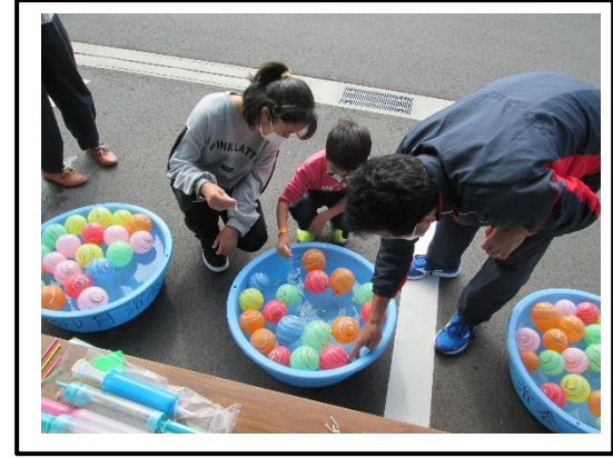
うまくとれるかな？