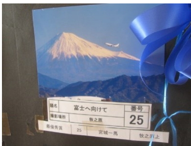
最優秀賞 宮城 一馬 「富士へ向けて」